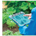
エコロジーと 食農システム入門