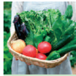
学際的 プロジェクト演習