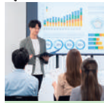
食農 インターン実習