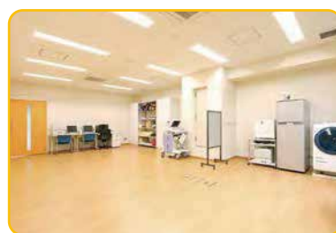
リハビリテーション室