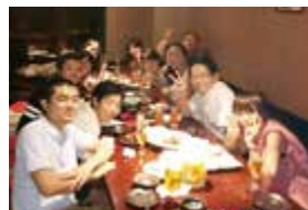
平成25年卒業 第1鍼灸学科(午前)

平成18年卒業(10周年)、平成 8 年卒業(20周年)、昭和61年卒業(30周年)、昭和51年卒業(40周年)、昭和41年卒業(50周年)