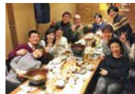
平成22年卒業 第1鍼灸学科(午後)