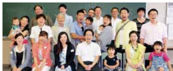
平成22年卒業 第2鍼灸学科(夜間)