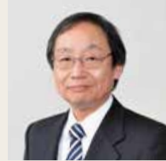
学校同窓会副会長(明友会担当) 鍼灸学科長

医学から治療医学、そして緩和医療までの幅広い分野に対応できるが、その秘密は皮膚の多機能性にありそうだ。21世紀は体表が脚光を浴びる時代になるであろう。そうなれば、鍼灸は一層面白くなる。この素晴らしい鍼灸医療を国民医療として発展させることが、今、最も必要なことである。それには、同窓会の底力が必要である。