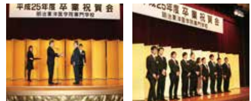
平成25年度卒業祝賀会

新たに学校同窓会の正会員として、本校で得た知識や技術を存分に発揮し、鍼灸師、柔道整復師として生涯に亘り、ご活躍されることを期待しております。