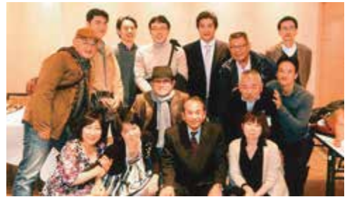
「卒業20周年」クラス同窓会

平成16年卒業(10周年)、平成6年卒業(20周年)、昭和59年卒業(30周年)、昭和49年卒業(40周年)、昭和39年卒業(50周年)